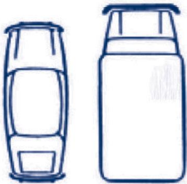
Grafico dell'incidente al momento dell'urto

Indicare i danni visibili al veicolo DRIVALIA